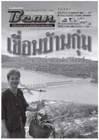
แบบปกวารสาร Bean ฉบับแรก

จากกรณีที่กรมพัฒนาพลังงานทดแทนและอนุรักษ์พลังงาน กระทรวงพลังงานได้ ได้นำเสนอการสร้างเขื่อนกั้นแม่น้ำโขง บริเวณบ้านกุ่ม ต.ห้วยไผ่ อ.โขงเจียม จ.อุบลราชธานี และอยู่ตรงข้ามบ้านกุ่มน้อย เมืองชะนะสมบุญ แขวง จำปาสัก สปป.ลาว ได้มีการจ้างบริษัทเอกชน ดำรวจศึกษาความเหมาะสมเบื้องต้น ของโครงการไฟฟ้าพลังน้ำเขื่อนบ้านกุ่ม มูลค่าการก่อสร้าง 120,390 ล้านบาท ระดับเก็บกักน้ำสูงสุด 115 เมตร เหนือระดับน้ำทะเลปานกลาง สามารถผลิตกระแสไฟฟ้าขนาด 1,872 เมกะวัตต์ หรือเฉลี่ยปีละ 8,012.17 ล้านหน่วย ส่วนรูปแบบตัวเขื่อนจะมีช่องทางระบายน้ำกว้าง 20 เมตร 22 ช่อง ช่องทางเดินเรือกว้าง 14 เมตร 2 ช่อง พื้นที่เก็บน้ำหน้าเขื่อน 84,456 ไร่